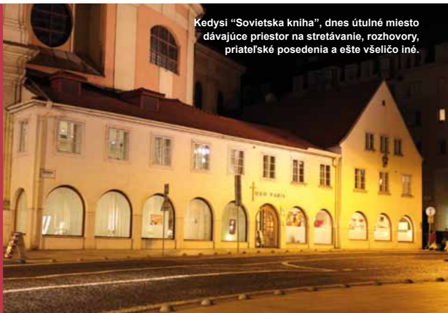
Kedysi "Sovietska kniha", dnes útulné miesto dávajúce priestor na stretávanie, rozhovory, priateľské posedenia a ešte všeličo iné.

Quo Vadis – (latinsky) kam kráčaš je otázka, ktorá chce mierne provokovať k zamysleniu. V dobe, kde je zvykom odpovedať bežím a nemám čas, sa v našom Dome Quo Vadis dá nachvíľu zastaviť a odpočinúť si. Človek hľadá zmysel života často v rýchlosti dní, ktoré plynú. Naším cieľom je ukázať krásu pozastavenia sa, okamihu, ktorý má zmysel tým, že je poznačený večnosťou.